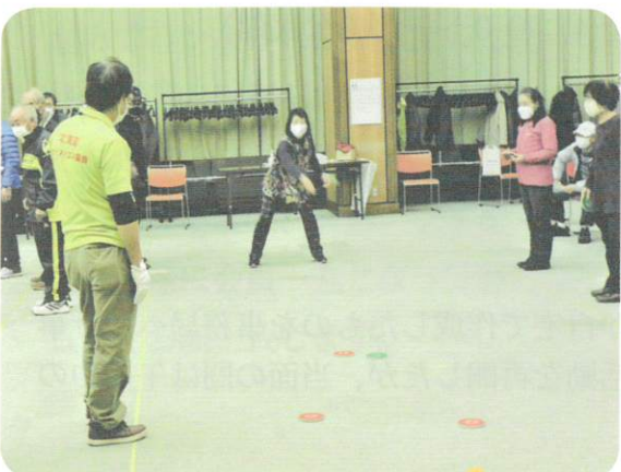
11月21日 カーリングコン競技体験会