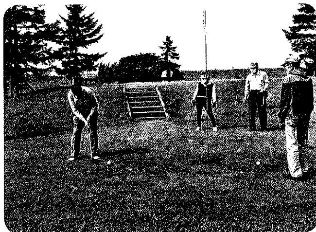
パークゴルフ大会のひとコマ