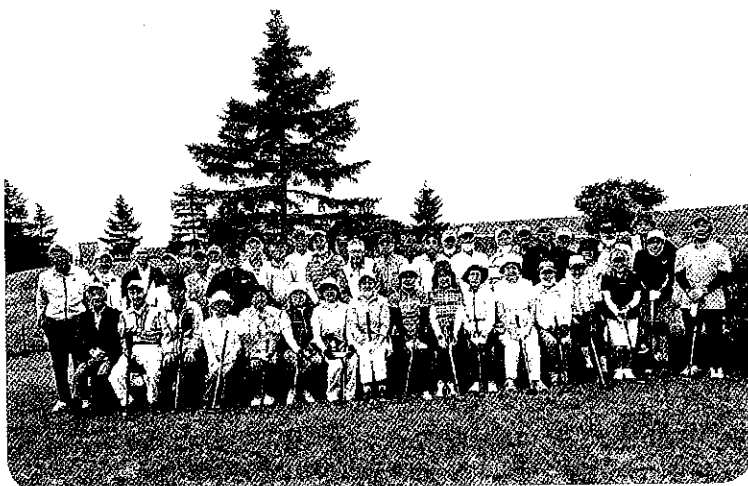
パークゴルフ大会参加者皆さんの記念撮影

一応に、「一日も早く仲間と活動をしたいが、自粛が長引くと会員のモチベーションを如何にして持たせていくか。会員を増やすことができるのか」と心配しており、これらの課題を共有し、少しでもより良い方向に進めていけたらと思います。