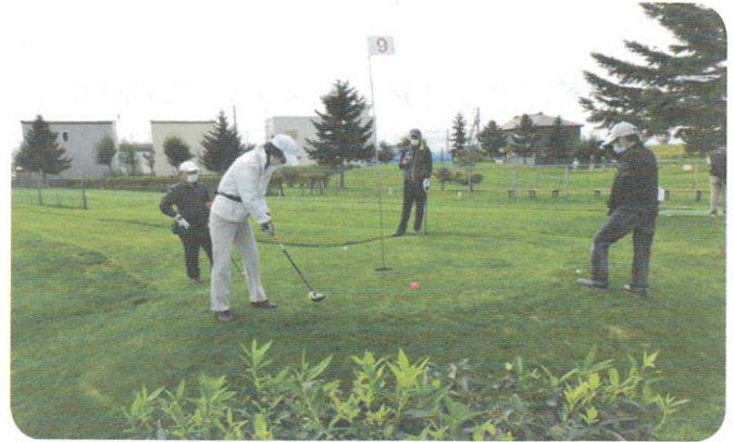
9月17日 第8回パークゴルフ大会