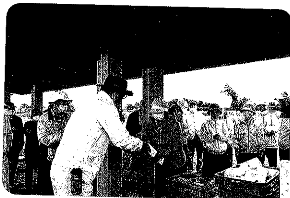
パークゴルフ大会表彰式