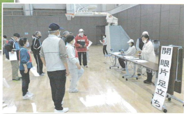
令和2年11月5日 体力測定会