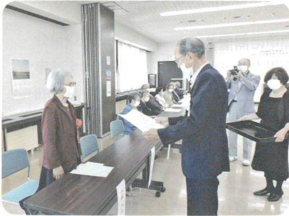
9月2日 高齢者健康優良者表彰式