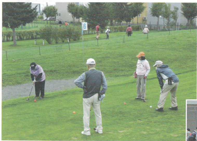
令和2年9月17日 第8回パークゴルフ大会