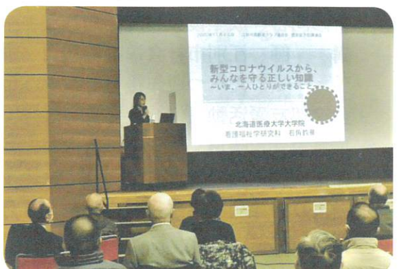
11月25日 感染症予防講演会