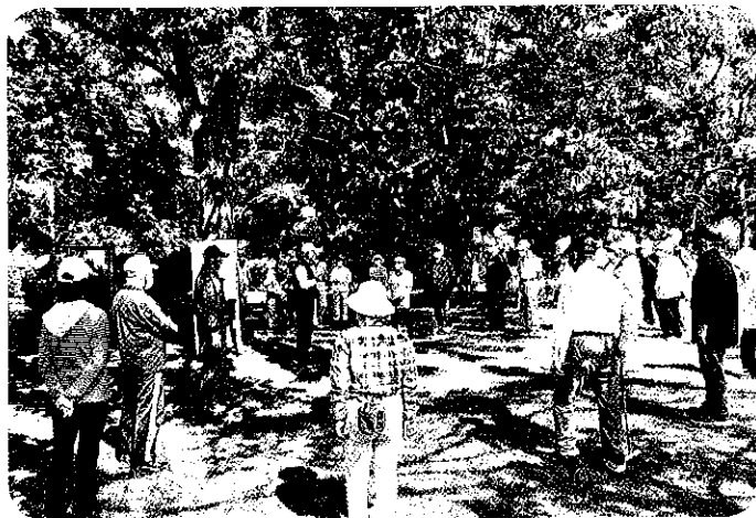
グリーンボール大会開会式

各クラブの活動状況の中で「パークゴルフ」が、各クラブよりの参加数が増加して、令和2年度は自粛規制のため4回の大会を実施しました。会員の皆さんは積極的に参加し、楽しんでもらえる様な同好会になりました。江高連の大会にも多数の会員が参加され今後益々盛んになると期待しています。グリーンボール大会も5チームが参加し、例年通り盛会でした。