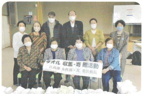
11月18日 タオル収集寄贈活動