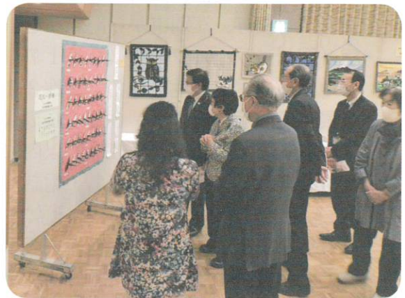
10月16日～19日 第6回会員作品展示交流会